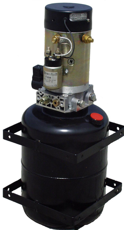
Compact Unit 24VDC